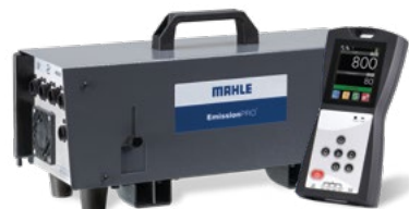
DMU 100 Opacimetro Codice: 1030400029xx