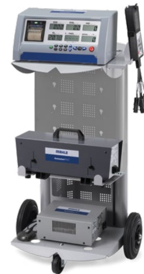
EmissionPRO® Configurazione A