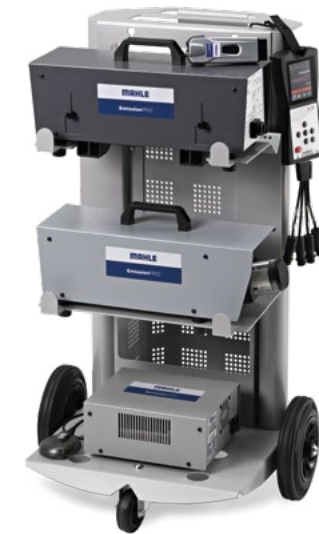
EmissionPRO® 150 Speciale per AU 5.1 Germania