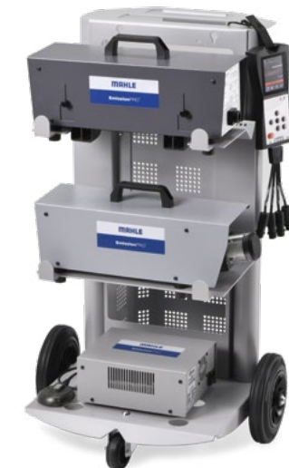
EmissionPRO® Configurazione B