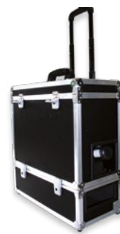
EmissionPRO® Mobile Speciale per AU 5.1 | Germania