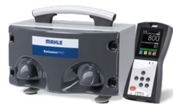
DMU 300 Opacimetro Codice: 1030400036xx