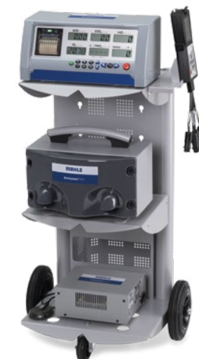
EmissionPRO® Configurazione C