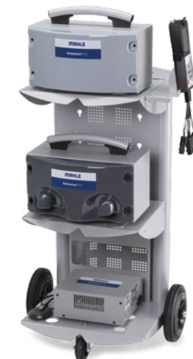
EmissionPRO® Configurazione D