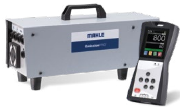
BMU 200 Analizzatore gas Codice: 1030500064xx

Non tutte le configurazioni e i dispositivi sono disponibili per tutti i mercati.