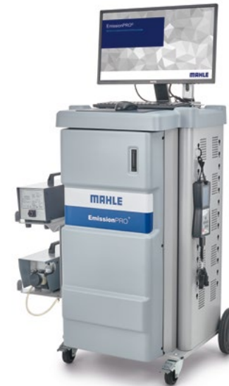
EmissionPRO® 180 Speciale per AU 5.1 Germania