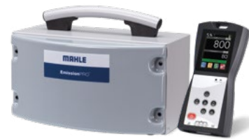
BMU 690 Analizzatore gas Codice: 1030500074xx