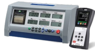
BMU 688 Analizzatore gas Codice: 1030400073xx