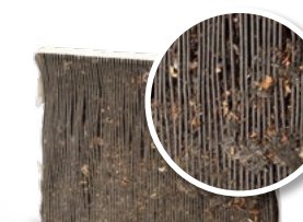
Senza manutenzione del sistema A/C