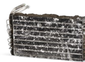
Senza manutenzione del sistema A/C