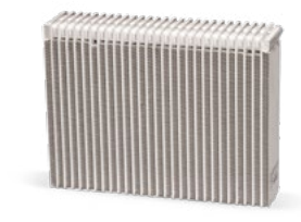
Con manutenzione del sistema A/C