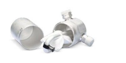
Con manutenzione del sistema A/C