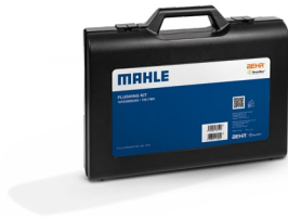
Flushing Kit R1234 M