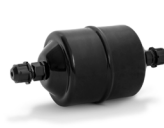
Dry filter LPP Line Cod. 1010350421XX