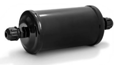
Dry filter MPP/HPP Line Cod. 1010350420XX