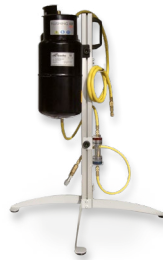
VAS Flushing Kit 134a/1234yf