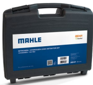
Nitrogen/Hydrogen leak detector Kit