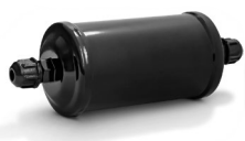
Dry filter MY 2018 Cod. 1010350402XX