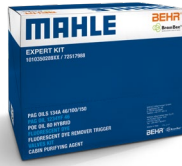
A/C System Desinfektionsspray